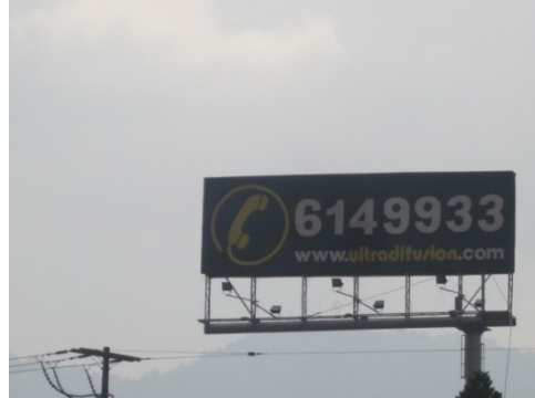
Foto 2. Texto de la Publicidad