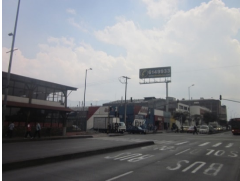
Foto No 1. Vista Panorámica OCC - OR